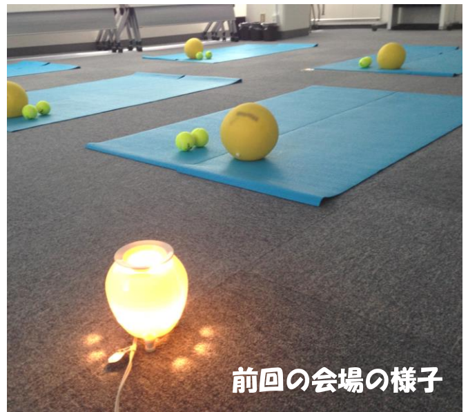
前回の会場の様子

居宅介護支援 訪問介護 障がい福祉 福祉用具のレンタル・販売 住宅改修 介護講座