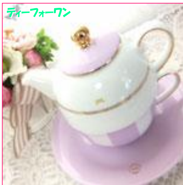
ティーフォーワン